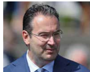
Gregor Baum Gestüt Brümmerhof

BEST SOLUTION entstammt einer alten Traditionslinie des Juddmonte Stud, eine starke Linie, die unser Blut bereichert. Interieur und Exterieur passen perfekt nach Deutschland.