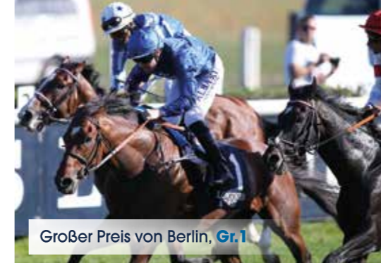
Großer Preis von Berlin, Gr.1