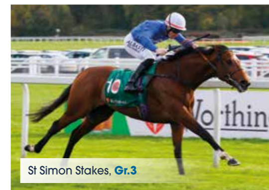
St Simon Stakes, Gr.3