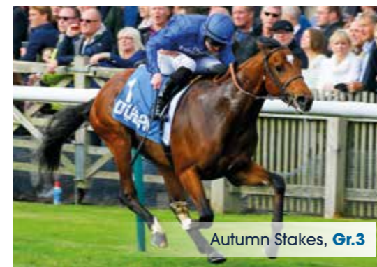
Autumn Stakes, Gr.3