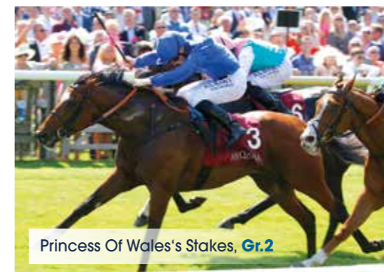
Princess Of Wales's Stakes, Gr.2