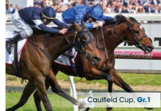
Caulfield Cup, Gr.1

SPEEDSTARKER 3facher Gr.1-Sieger mit einem beeindruckenden turn of foot