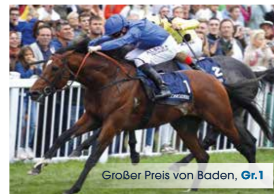
Großer Preis von Baden, Gr.1