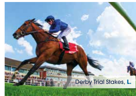
Derby Trial Stakes, L.